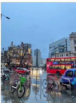
Hammersmith Bus Station

Besonders beeindruckte mich das internationale Team, mit dem ich an diesem Projekt arbeitete. Die Kollegen waren außergewöhnlich offen, freundlich und hilfsbereit. Eine multikulturelle Umgebung förderte nicht nur den fachlichen Austausch, sondern auch den interkulturellen Dialog, der für mich zu einer bereichernden und inspirierenden Erfahrung wurde. Da Englisch als Hauptsprache von allen beherrscht wurde, stellte die Kommunikation kein Problem dar.