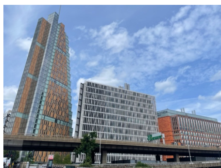
Imperial College White City Campus